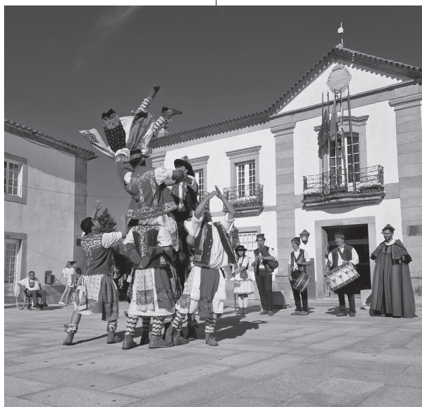
Pauliteiros de Miranda - Dançadores de Miranda